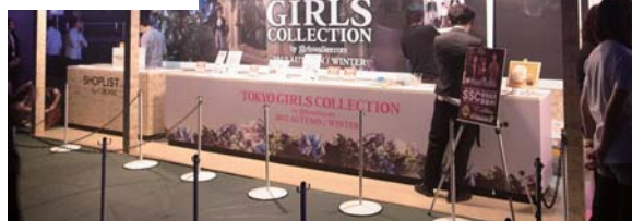
【東京ガールズコレクション公式ブース】に設置されたフルノシステムズ製アクセスポイント