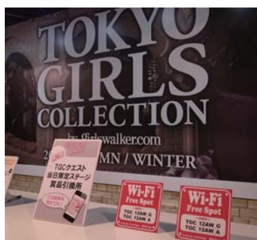
【東京ガールズコレクション公式ブース】「無線 LAN フリースポット」をアナウンス